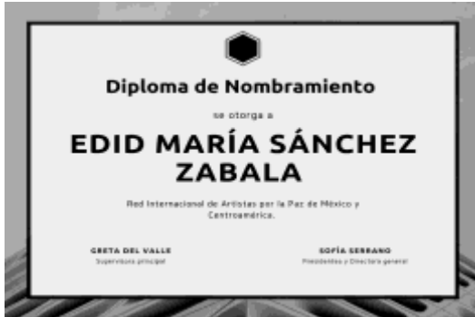
Imagen 23: Certificado de nombramiento como miembro permanente

Formo Parte desde el 2019 de la Red Internacional de Artistas por la Paz de México y Centroamérica como integrante de la asociación de pintoras mexicanas en donde impartimos talleres para niños y niñas de las Zonas de marginación en Ciudad de México, actualmente somos 30 miembros permanentes. Imagen 23