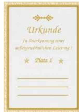
Imagen 21y 22: Reconocimiento de Premiación y ceremonia del concurso "Miradas"