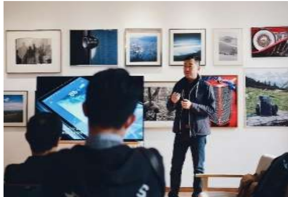
Imagen 7: Plática el arte en tu colonia

Generación de conocimiento, creatividad, ingenio, inventos o producción científica.