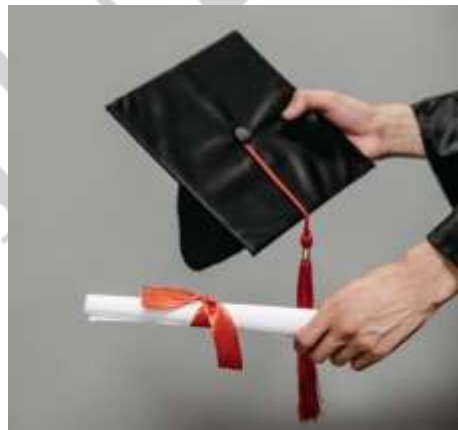
Imagen 2: fotografía de la ceremonia de graduación

Realice una estancia en Chicago becada por la Universidad de artes, posteriormente realice 2 diplomados en el mismo país con las cuales puede ganar créditos para graduarme, los cuales fueron Preparación de piezas: lijado, empastados, Pintura con pistola aerográfica y electroestática, Preparación de colores y por último ordenar pinturas y materiales, en el 2005 culmine mis estudios en Técnicas de colores por la universidad. Imagen 2