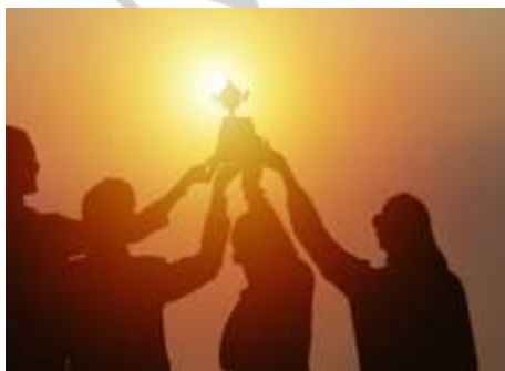
Imagen 19: fotografía e participación

Participante del concurso Nacional de arte en dibujo en el 2010 Imagen 19