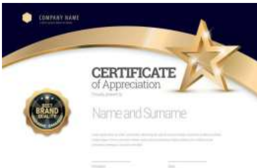
Imagen 18: Constancia de Participación

Participante de la primera emisión de mural en Chiapas 2021 en donde participaron más de 300 propuestas del estado Imagen 18