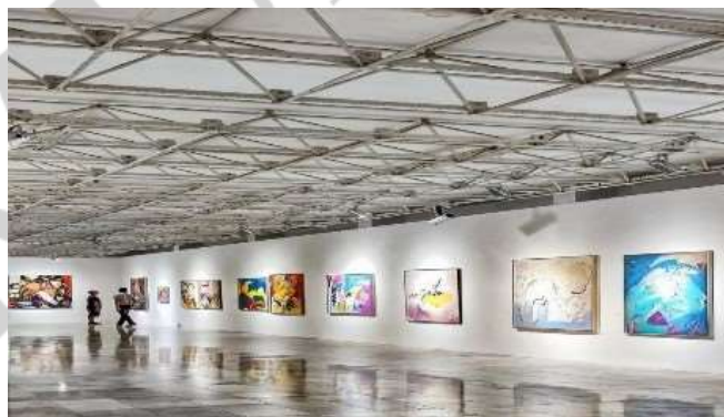
Imagen 16: galería “Chiapas”

Soy fundadora de la Galería comunitaria de arte y artesanía “Chiapas” en la Ciudad de México, en donde se expone a la venta arte y artesanía de 5 etnias indígenas de Chiapas colaborando así a la economía de las comunidades indígenas. Imagen 16