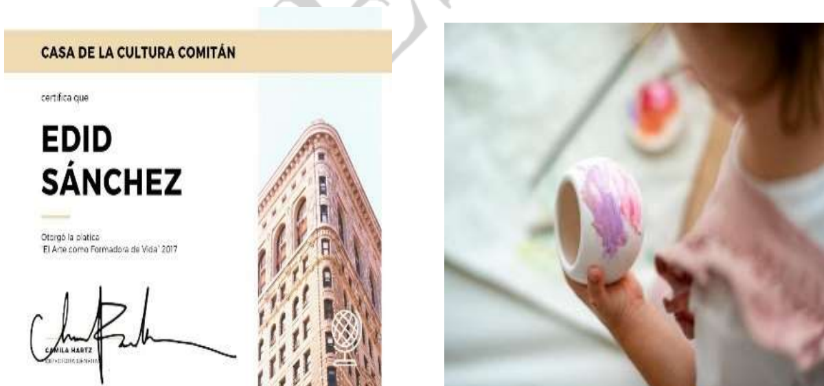
Imagen 4 y 5: Reconocimiento obtenido como capacitadora del taller e imágenes de lo niños artistas participante.

Realicé un taller Artístico para niños y niñas de Tuxtla Gutiérrez 2010 en donde tuve la oportunidad de capacitar a niños de escasos recursos para la realización de material artístico reutilizable, este taller se ha replicado 3 veces al año. Imagen 4 y 5