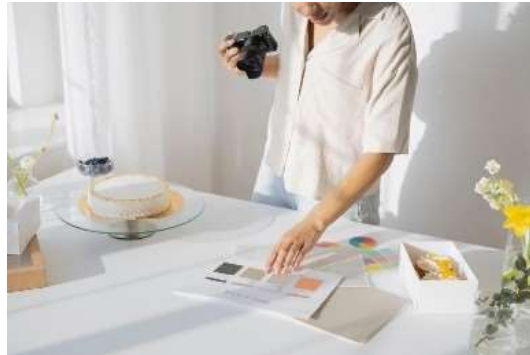
Imagen 17: Actividades como directora del centro cultural Salomón González Blanco

Directora de Cultura y artes del centro cultural Salomón González Blanco desde 2019 hasta la Actualidad. Imagen 17