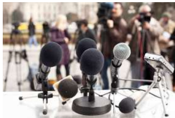
Imagen 8 y 9: Portada de la revista y rueda de prensa de presentación.