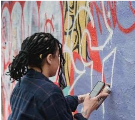
Imagen 6: Murales del proyecto arte en tu colonia