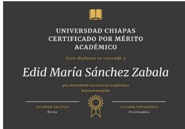
Imagen 3: certificación en idiomas

Mi lengua materna es zoque a un 80% tanto escrita como hablada además de dominar el inglés tanto escrito como hablado en un 70% cuento con una certificación para poder ejercer ambos idiomas como traductor interprete certificado. Imagen 3