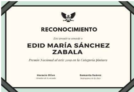
Imagen 20: Reconocimiento de Premiación

Soy ganadora del Premio Nacional al arte 2019 en la Categoría pintura, premio que reconoce la trayectoria de las y los artistas mexicanos destacados. Imagen 20