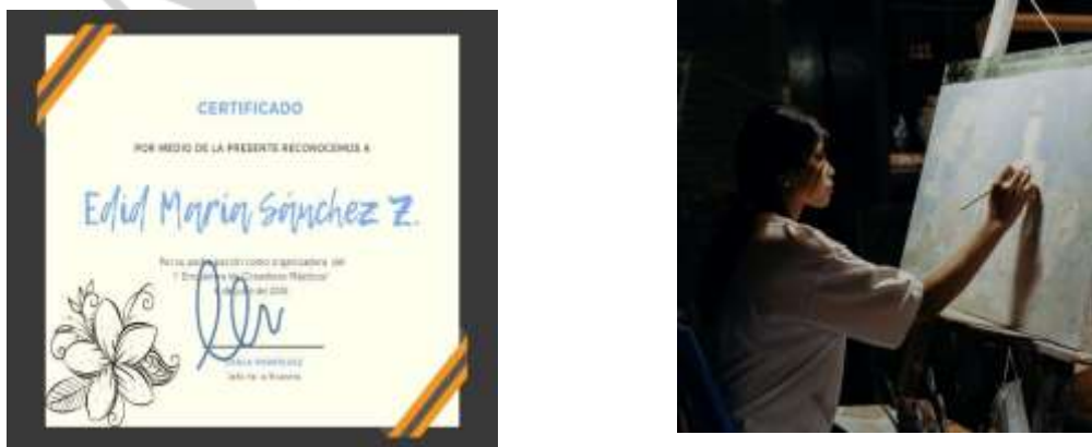
Imagen 14: Reconocimiento y fotografía de participación en el encuentro.

Organice junto a mujeres del estado de Chiapas el encuentro de creadores plásticos 2015 en donde se logró reunir a más de 15 creadores con trayectoria de Chiapas. Imagen 14