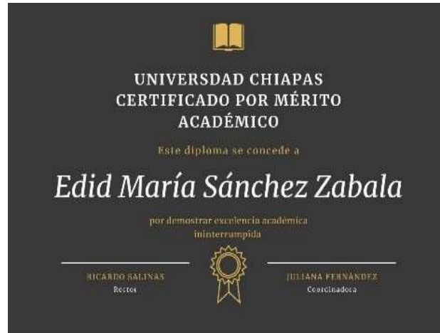
Imagen 1: reconocimiento de mérito académico

Soy Licenciada en artes por la Universidad Chiapas en donde obtuve mérito académico con un promedio de 10.0. Imagen 1