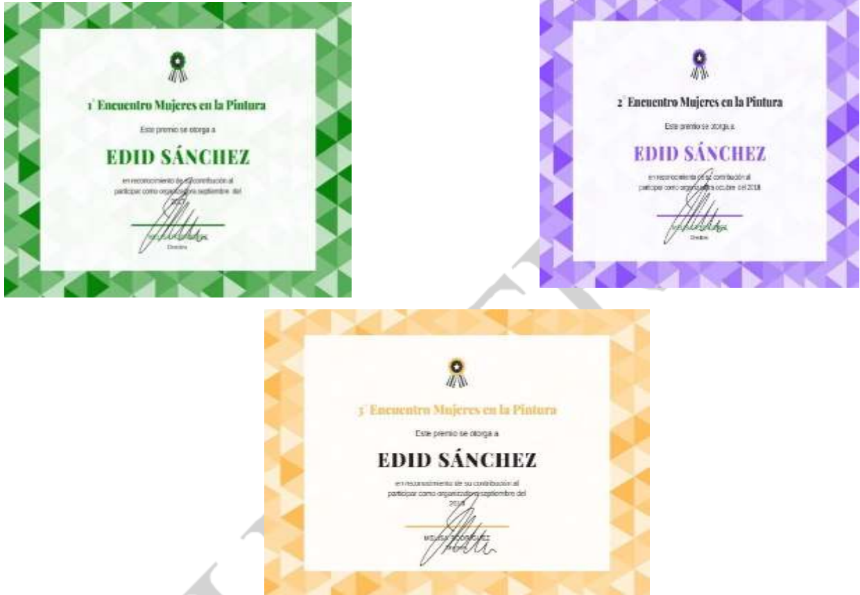
Imagen 13: Reconocimiento de participación en el Encuentro de Mujeres en la Pintura

Participe en el encuentro en Michigan de Mujeres en la pintura en la primera, segunda y tercera emisión. 2017,2018 y 2019 en dondehan participado más de 2 mil mujeres a lo largo de las emisiones. Imagen 13