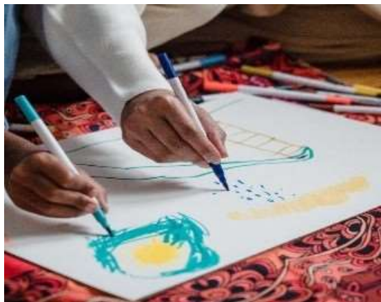
Imagen 15: Talleres de niños en la zona de Chiapas

Soy fundadora en el 2013 la asociación civil Niñez en el Arte con el fin de integrar a niñas y niños de las zonas vulnerables de Ocoatepec Chiapas, en él participan más de 200 alumnos y 15 voluntarios en todos los talleres que se ofrecen, desde iniciación del arte hasta la profesionalización para venta y exportación de los trabajos finales, mi actividad dentro de este grupo es organizar y gestionar todas las actividades sin ningún pago puesto que es una organización independiente. Imagen 15